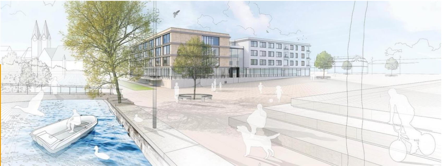
Hotelprojekt IBB Eichstätt, Hotelprojekt zur Pacht