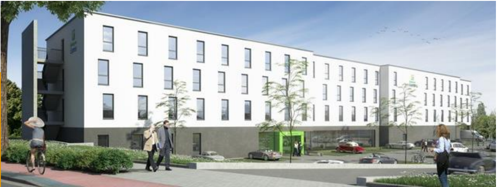
HIEX Sindelfingen, Hotelprojekt zur Pacht