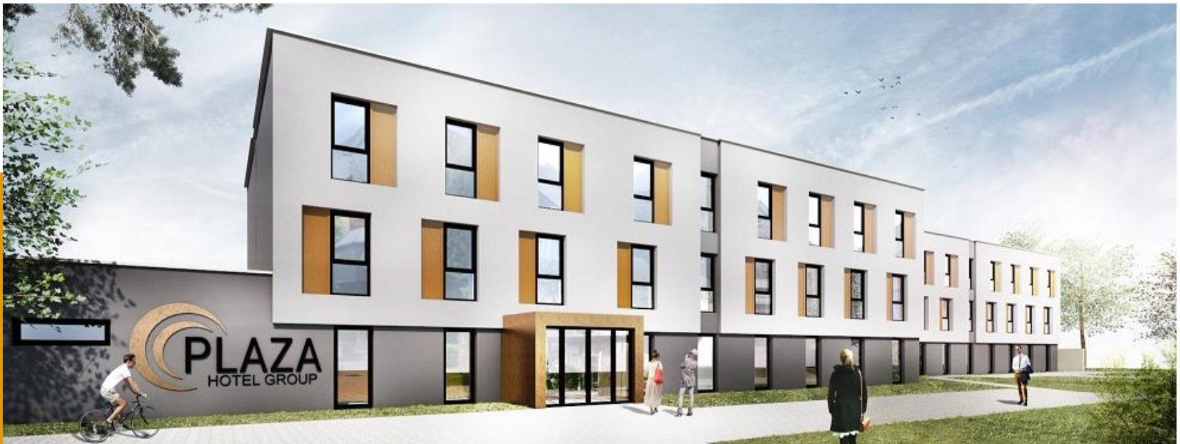
PLAZA Hotel Recklinghausen, Hotelprojekt zur Pacht