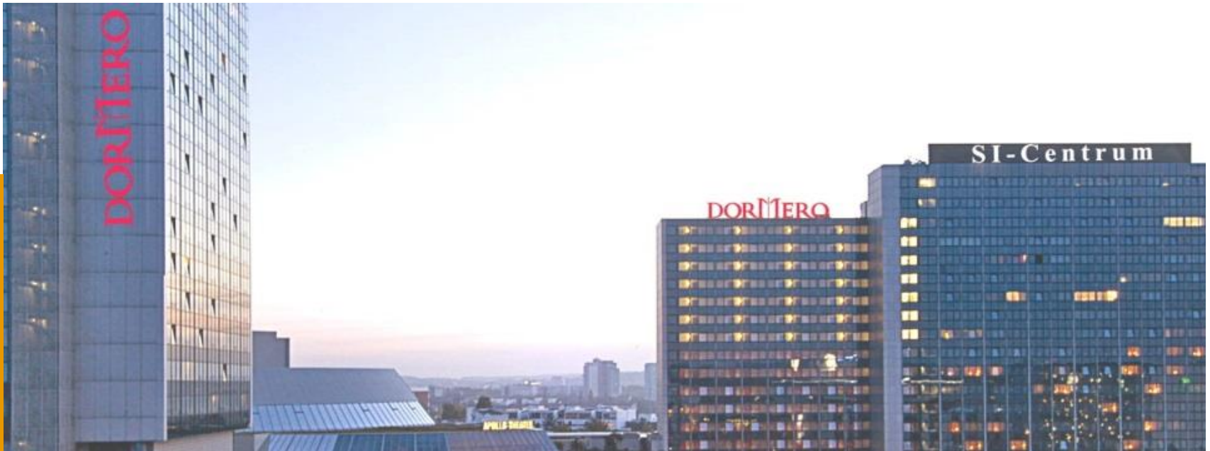
Dormero Hotels im SI-Centrum Stuttgart, Hotelimmobilie zur Pacht