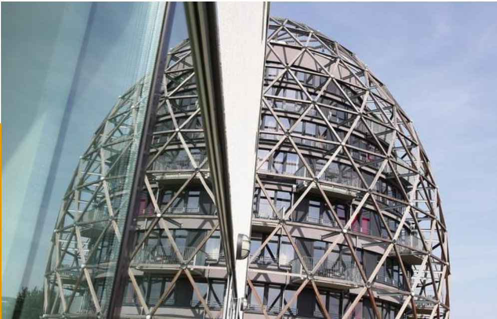
Hotel Oversum in Winterberg, Hotelimmobilie zum Verkauf