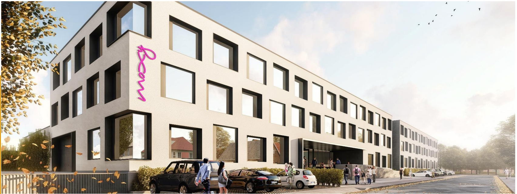
Moxy Hotel Rust, Hotelprojekt zur Pacht